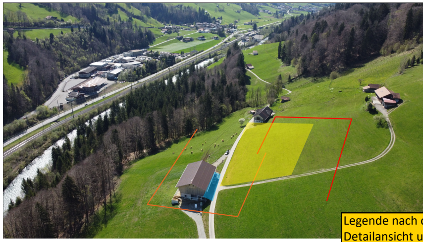
Legende nach oben schieben und Detailsicht unten platzieren.